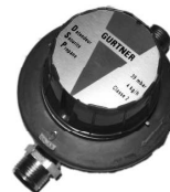
Détendeur Sécurité Propane

Conditions to use (to be kept by the user)