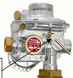
Modèle B25/BCH30 : Manette de réarmement